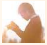
Photographer 安宅 真樹

Profile 15年前に鳥取県にターン。風景写真家として活動する一方、写真を活用した地域活性事業にも従事する。鳥取県での活動が評価され、現在まで全国10以上の自治体のコンサル業務を請け負ってきた。東京カメラ部2013年10選。近年では、アサヒカメラでの特集記事ほか、JR西日本の広報媒体も担当し、2018年の山陰DCではメインカメラマンを担当。8月には第2弾写真集「24Hours」を発売、あわせて9月には植田正治写真美術館にて個展を開催予定。(東京カメラ部10選)